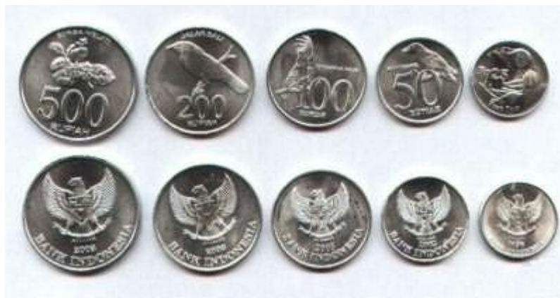
เหรียญอินโดนีเซีย

สกุลเงินอินโดนีเซียที่ใช้ เรียกว่า รูเปียห์ (Rupiah: IDR) ประกอบด้วย ธนบัตร และเหรียญกษาปณ์ ต่างๆ ดังภาพ