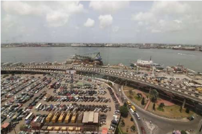
เมืองเลกอส ประเทศไนจีเรีย

เมื่อวันที่ 7 กรกฎาคม ปี 2019 นายโมฮามาตู บูฮารี ประธานาธิบดีไนจีเรียได้ร่วมลงนาม The African Continental Free Trade Agreement (AfCFTA) ณ ที่ประชุมสหภาพแอฟริกา (AU Summit) ซึ่งถูกจัดขึ้นที่เมืองเนียเม (Niamey) ประเทศไนเจอร์ ทำให้ไนจีเรียกลายเป็นประเทศลำดับที่ 55 ซึ่งเข้าร่วม AfCFTA และเป็นสัญญาณดีว่าในอนาคตอันใกล้ AfCFTA จะมีผลบังคับใช้ได้จริง และเป็นจุดเปลี่ยนสำคัญของเศรษฐกิจแอฟริกา