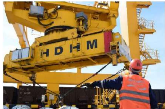
ภาพ: คนงานกำลังขนส่งเหล็ก ณ Khorgos Gateway ที่ตั้งอยู่ชายแดนระหว่างคาซัคสถานกับจีน

ภายใต้สถานการณ์ที่เศรษฐกิจเอเชียมีแนวโน้มชะลอตัว ซึ่งรวมถึงเศรษฐกิจของคาซัคสถานเอง อย่างไรก็ตาม คาซัคสถานเองก็กำลังเสริมสร้างศักยภาพให้เศรษฐกิจของประเทศ เพื่อรอการฟื้นตัวของเศรษฐกิจโลก ด้วยการเริ่มดำเนินงานโครงการ Belt and Road ขนาดใหญ่ของจีน ณ บริเวณชายแดนระหว่างคาซัคสถานและจีน