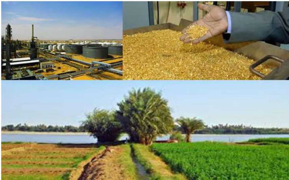
ภาพ: โรงกลั่นน้ำมันที่พอร์ตซูดาน (ซ้ายบน) ทองคำของซูดาน (ขวาบน) แม่น้ำไนล์และแปลงเกษตร (ล่าง)