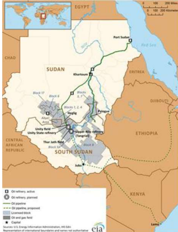
Key oil infrastructure in Sudan and South Sudan