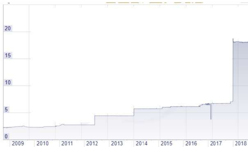
ภาพ: ค่าเงินซูดานปอนด์ ต่อ 1 ดอลลาร์สหรัฐฯ (อัตราทางการ)