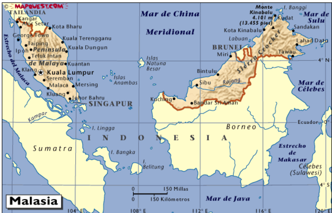
ภาพที่ 1.1 แผนที่ประเทศมาเลเซีย

มาเลเซีย มีพื้นที่ประมาณ 330,252 ตารางกิโลเมตร (ประมาณร้อยละ 64 ของไทย) ตั้งอยู่ในเขตเส้นศูนย์สูตร ปัจจุบันแบ่งออกเป็นสองส่วนคือ ส่วนที่ตั้งอยู่บนคาบสมุทรเรียกว่า มาเลเซียตะวันตก หรือที่เรียกว่า เพนินซูลามาเลเซีย (Peninsula Malasia) ตั้งอยู่ปลายคาบสมุทรอินโด และส่วนที่อยู่ในเกาะบอร์เนียว เรียกว่า มาเลเซียตะวันออก อยู่ในเกาะบอร์เนียว ทางด้านเหนือต่อจากกาลิมันตันของอินโดนีเซีย ทั้งสองส่วนนี้ประกอบด้วยรัฐต่างๆ 13 รัฐ อยู่ในมาเลเซียตะวันตก 11 รัฐ อยู่ในมาเลเซียตะวันออก 2 รัฐ